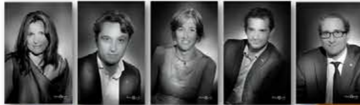
De vraies stars !!!